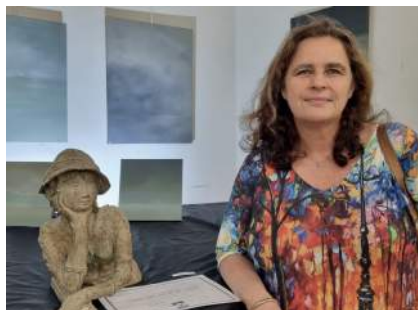
«Alphonsine», un bronze de Virginie Desmeulles , le Prix du Public pour la sculpture