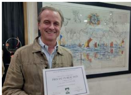
«Parade dans le Golfe» de Stéphane Labous , le Prix du Public pour la peinture.